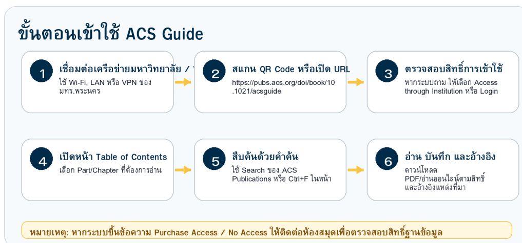
ภาพที่ 2 ขั้นตอนการเข้าใช้ฐานข้อมูล ACS Guide อย่างละเอียด