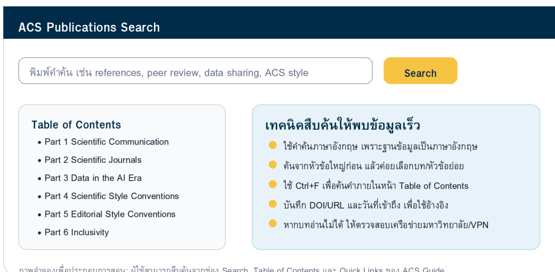
ภาพที่ 3 วิธีสืบค้นข้อมูลใน ACS Guide ให้พบหัวข้อที่ต้องการ