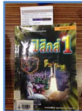
โบรชัวร์แนบกับตัวเล่มหนังสือที่ได้ทำการยืม

Keyword : การยืมต่อ, ยืมต่อ, ออนไลน์, renew, OPAC