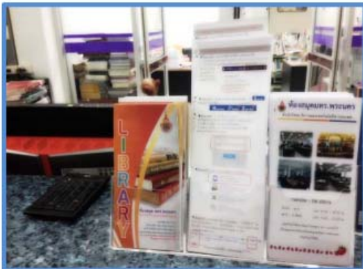
เอกสารเผยแพร่เกี่ยวกับห้องสมุด ให้บริการแวนเคาน์เตอร์ให้บริการยืม - คืน

ได้จัดทำสื่อการแนะนำการยืมต่อ (renew) ระบบออนไลน์ (OPAC) ในรูปแบบโบรชัวร์เพื่อความสะดวกแบบพกพาให้ผู้ให้บริการที่มาเยี่ยมทรัพยากรสารสนเทศ สามารถแนบโบรชัวร์นี้กับตัวเล่มหนังสือที่ได้ทำการยืม เพื่อให้ผู้ใช้บริการที่ไม่ทราบหรือลืมวิธีขั้นตอนการยืมต่อ โดยดูจากโบรชัวร์เพื่อเข้าใช้บริการยืมต่อระบบออนไลน์จากเว็บไซต์ห้องสมุดอัตโนมัติได้